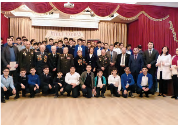
Veteranların məktəblilərlə görüşü