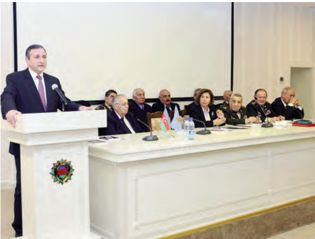
Azərbaycan Respublikası Müharibə, Əmək və Silahlı Qüvvələr Veteranları Təşkilatının V plenumu