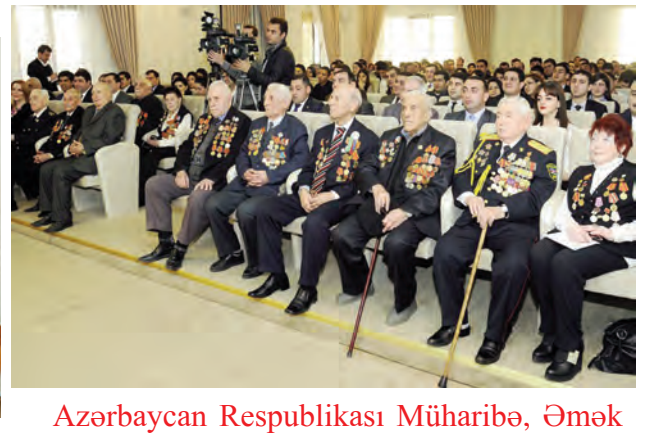
Azərbaycan Respublikası Müharibə, Əmək və Silahlı Qüvvələr Veteranları Təşkilatında Gənclər Birliyinin üzvləri ilə görüş

Baş redaktor Ülvi İBRAHİMLİ Məsul katib Səidə ABDULLAYEVA