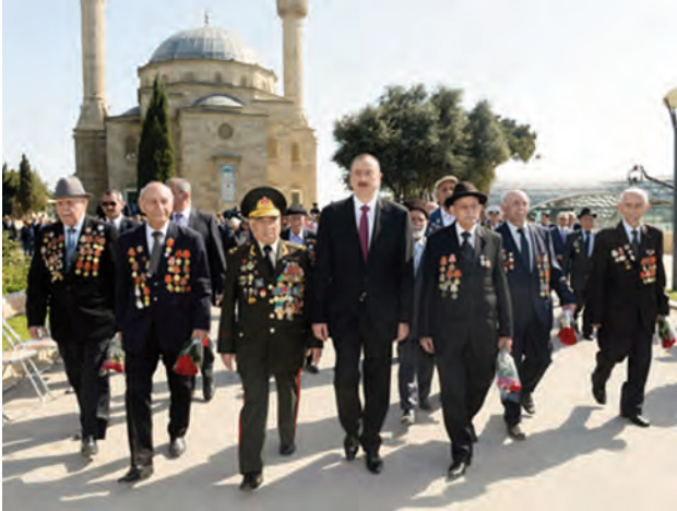
Ali Baş Komandan veteranların əhatəsində