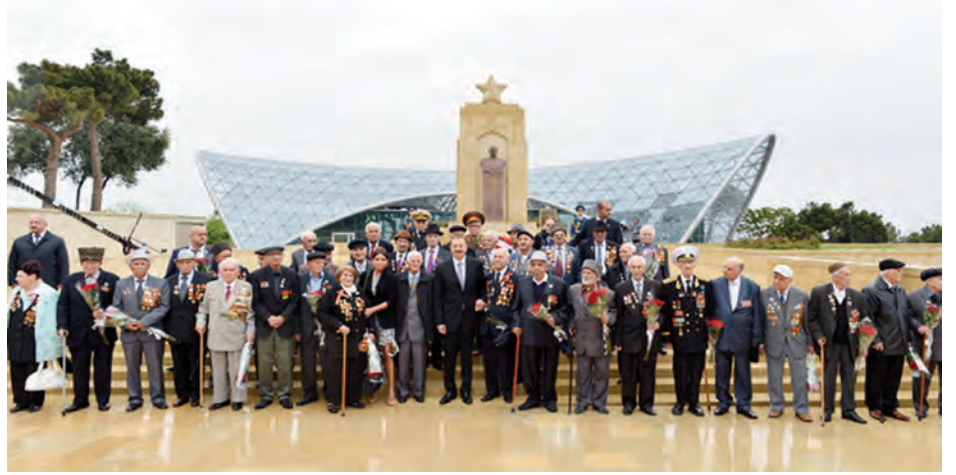
Azərbaycan veteranları cənab prezident İlham Əliyevlə Sovet İttifaqı Qəhrəmanı Həzi Aslanovun abidəsi önündə