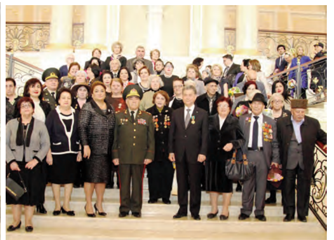
"Böyük Vətən müharibəsində Azərbaycanın rolu" mövzusunda elmi-praktik konfrans