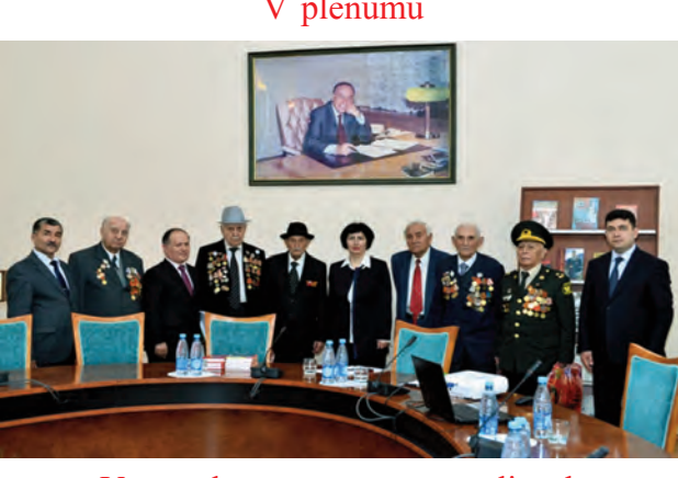
Veteranlarımız vətənpərvərliyə həsr edilmiş elmi konfransda