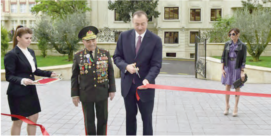
Müharibə, Əmək və Silahlı Qüvvələr Veteranları Təşkilatının yeni inzibati binasının açılışı

Yaşayın, əziz veteranlar! Canınız sağ, ömrünüz uzun, çöhrəniz həmişə sevincli olsun. Qazandığınız Qələbə Günü, 9 May bayramınız mübarək!