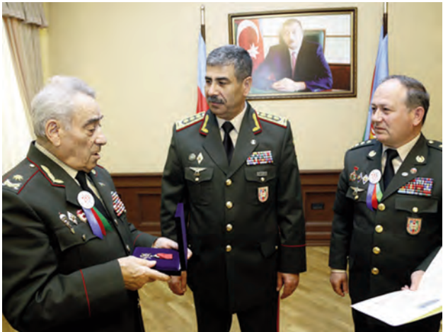
Müdafiə naziri Zakir Həsənova "Veteran həmrəyliyi" medalı təqdim olunarkən